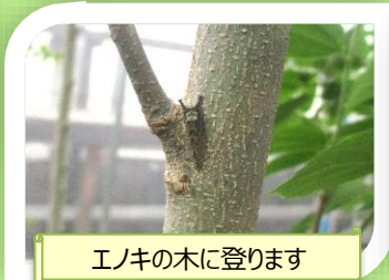
エノキの木に登ります