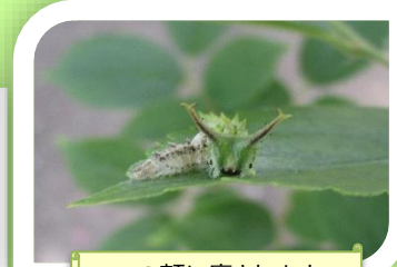
この顔に癒されます