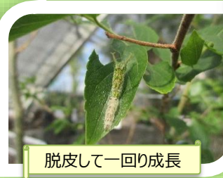
脱皮して一回り成長