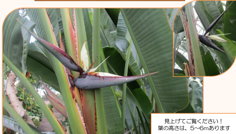
見上げてご覧ください！ 葉の高さは、5~6mあります

ストレリチア・オーガスタは、ゴクラクチョウカに似ていますが、大きな葉が特徴です。温室内展望台の階段の途中で 近くから見る事ができます。熱帯の植物らしく、迫力のある姿を是非ご覧ください。