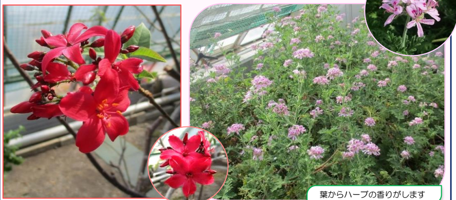
葉からハーブの香りがします

"ナンヨウザクラ"が赤い花を咲かせています。ピンクの桜もきれいですよ、赤も可愛いですよ。(原産地の地名をとって、キューバザクラとも言われます) "ローズゼラニウム"の花の群れが見られます。とても小さい花ですが、たくさん咲くと見事です。温室の一番奥の出口付近、ステージの横で咲いています。