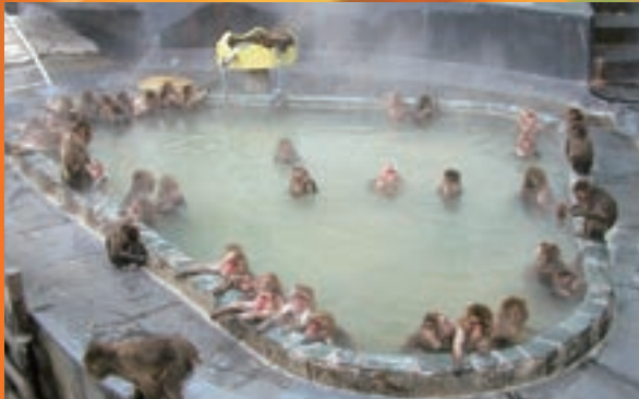
在温泉里暖身的日本猴