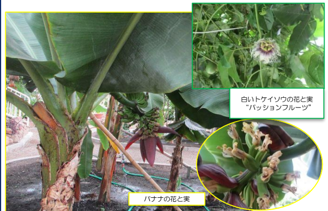
白いケイソウの花と実 "パッションフルーツ"