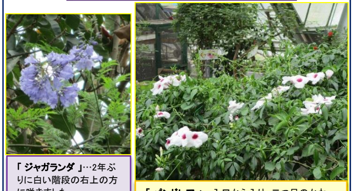
「ジャガランダ」…2年ぶりに白い階段の右上の方に咲きました。